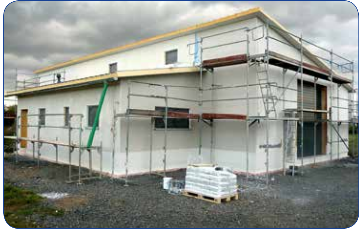
Demnächst in Fritzlär mit neuer Halle!