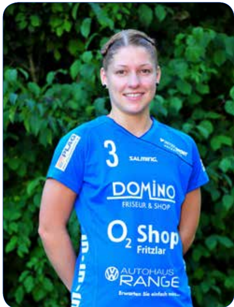
Lena Dietrich.

Bad Salzuflen. Die Drittliga-Handballerinnen des SV Germania Fritzlar haben den ersten Auswärtserfolg der Saison eingefahren. Mit 25:20 (10:9) gewann das Team von Trainerin Viktoria Marquardt bei der SG Handball Bad Salzuflen.